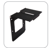
подставка eCam для монтажа камеры

* Для получения более подробной информации обратитесь на сайт www.avervcs.ru/warranty