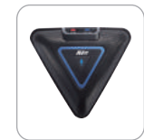
дополнительный набор микрофонов